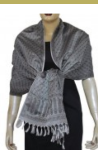
Long foulard en soie...